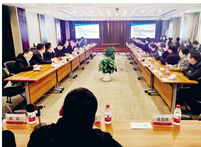
较大情况下,如何对企业经营风险防范方面采取的经验措施等进行了

会议期间,针对在当前的经济形势下,作为民营企业如何为实现持续稳步高质量发展而进行产业转型、产品升级等方面的做法;以及公司在面对管理革新和市场环境变化