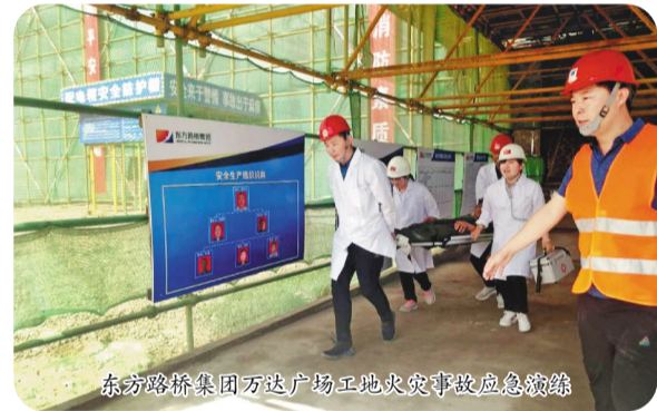
东方路桥集团万达广场工地火灾事故应急演练