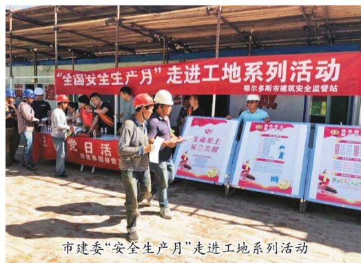
市建委“安全生产月”走进工地系列活动