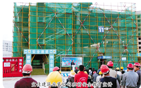
宜佳建筑安装公司班前安全教育宣讲