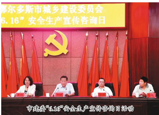
市建委“6.16”安全生产宣传咨询日活动