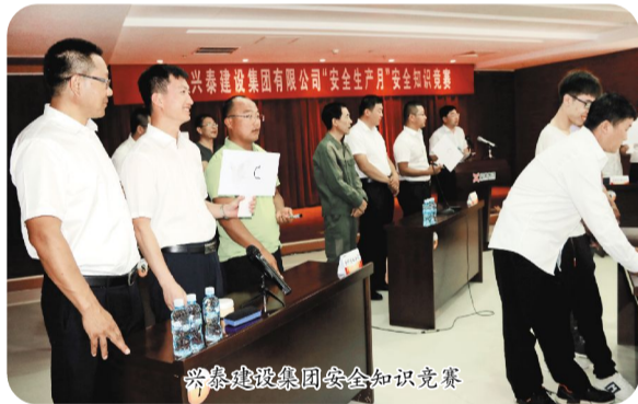
兴泰建设集团安全知识竞赛