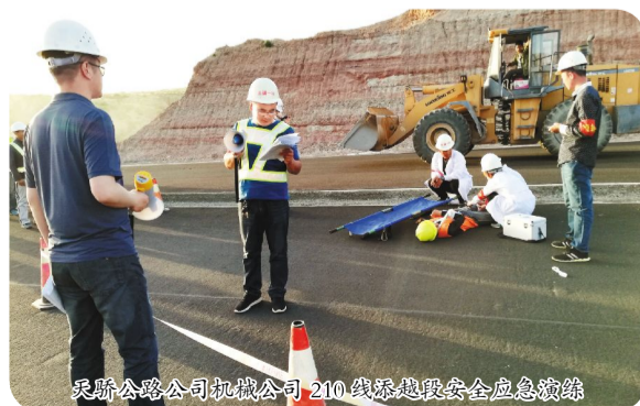
天骄公路公司机械公司210线交通事故安全应急演练