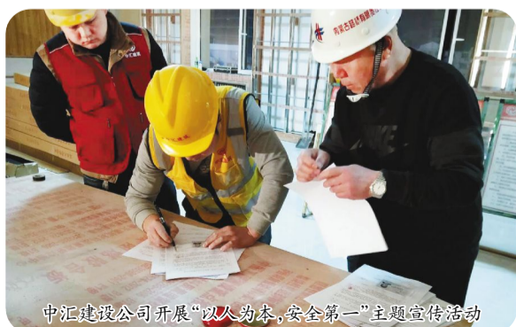
中汇建设公司开展“以人为本，安全第一”主题宣传活动

“思多久方为远见，行多久方为执着。”在稳定发展的道路上，我市建筑行业追求安全发展的脚步永不停歇，誓将打造永不落幕的“安全生产月”。